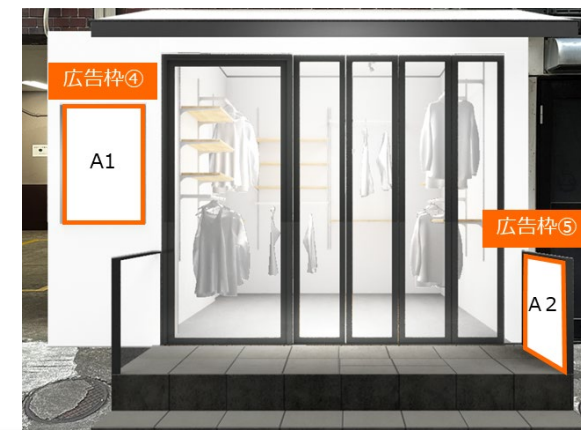
④MINIエントランスポスター枠 ⑤MINI手すり側面ポスタースペース