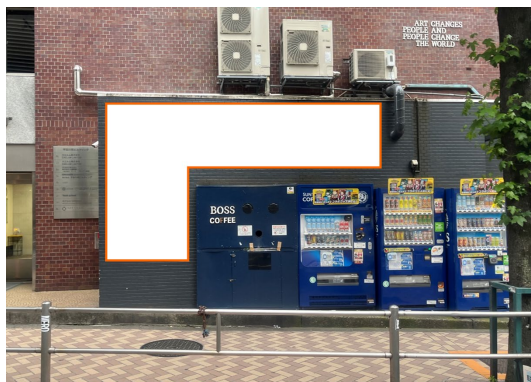
③ビル側壁ポスター枠